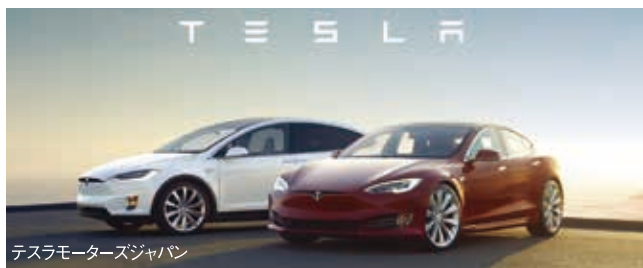
テスラモーターズジャパン