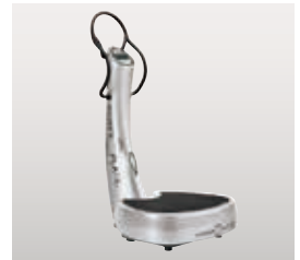
機器提供: (株)プロティアジャパン