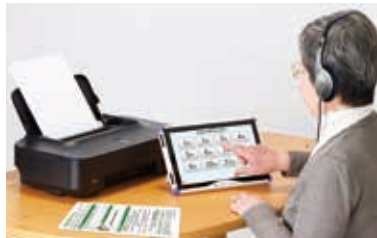
機器提供: 日本光電工業(株)