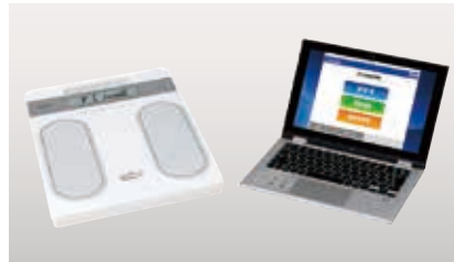
機器提供: (株)タニタ