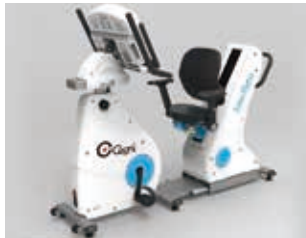
機器提供: インターリハ(株)